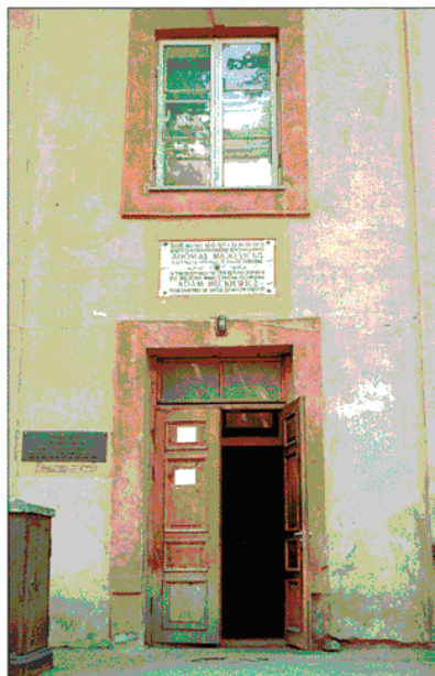
Wejście do dawnego klasztoru Bazylionów w Wilnie, w którym znajduje się cęła Konrada

● Wiersz Do przyjaciół Moskali – wspomnienie przyjaciół z kręgu dekabrystów – Bestużewa i Rylejewa, straconych z rozkazu cara.